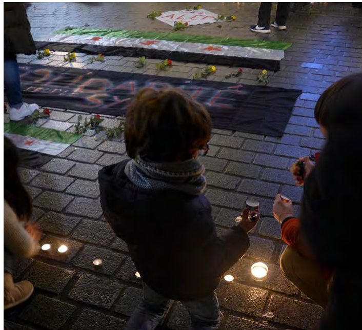
Rassemblement en solidarité avec la population d'Alep, place de la République à Rennes le 15 décembre.