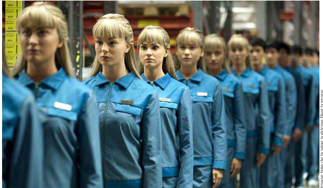
Image tirée de la série suédoise Real Humans

En arrivant à Rennes, ce qui m'a le plus surpris, ce sont les uniformes, il y en a partout. Les enfants vont à l'école, vêtus d'un ensemble, bleu pour les garçons et rouge pour les filles. J'ai aussi appris que les enseignants se doivent de porter une blouse blanche, ce qui est du meilleur effet dans les classes, désormais toutes ornées d'un drapeau tricolore assorti. Dans la rue, de jeunes militaires patrouillent, fusil en bandoulière. Les agents armés de la police municipale circulent en voiture électrique et contrôlent ce qui peut être sanctionné.