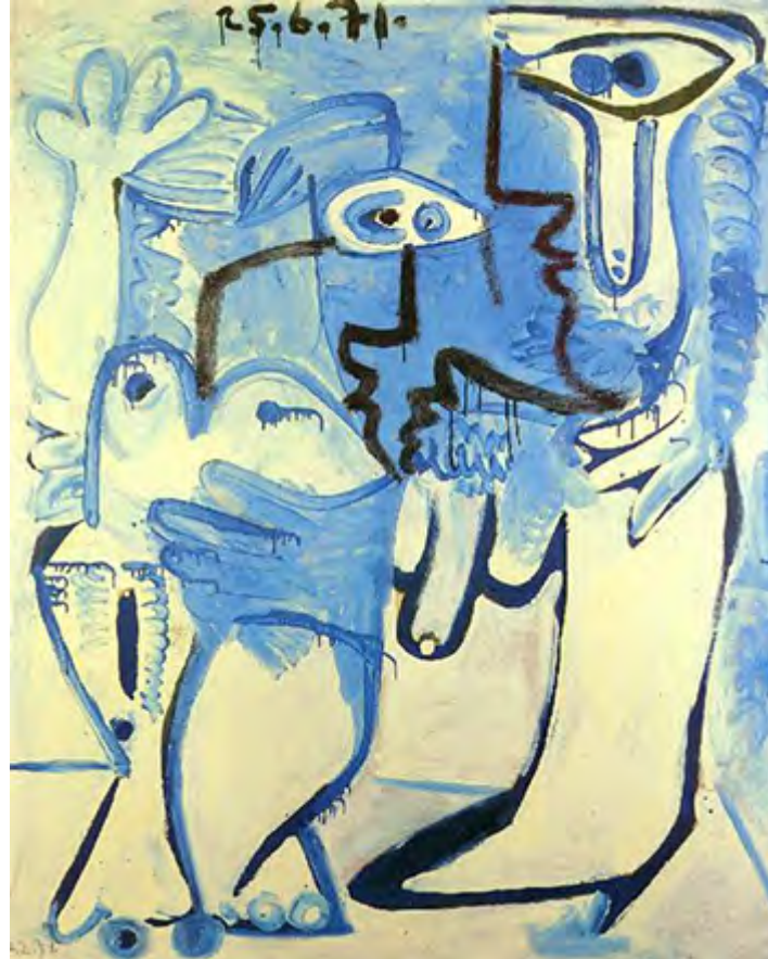
Pablo Picasso. Homme et femme

Comme je disais, j'aime les hommes et je trouve normal que mon frère aussi. En fait, je ne me suis jamais posé la question en tant que problème, car c'était un fait. Le problème venait de l'extérieur, surtout à l'époque où l'homosexualité était encore un délit et une maladie mentale. Mon frère n'a jamais correspondu à un genre ni efféminé ni super viril, et depuis quinze ans, il est marié à une femme dont le