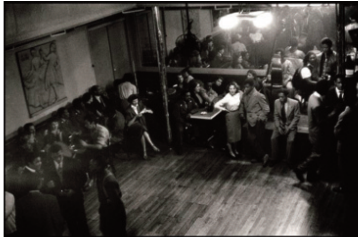
Le Bal nègre du 33, rue Blomet à Paris en 1952.

Un ami guadeloupéen âgé de 80 ans m'a dit : «J'ai connu le bal Blomet, après la 2 e guerre. On y croisait de Beauvoir, Sartre, Vian. À cette époque la réputation du bal n'était pas flatteuse. Hormis les intellectuels reconnus, peu de métropolitains le fréquentaient. Quant