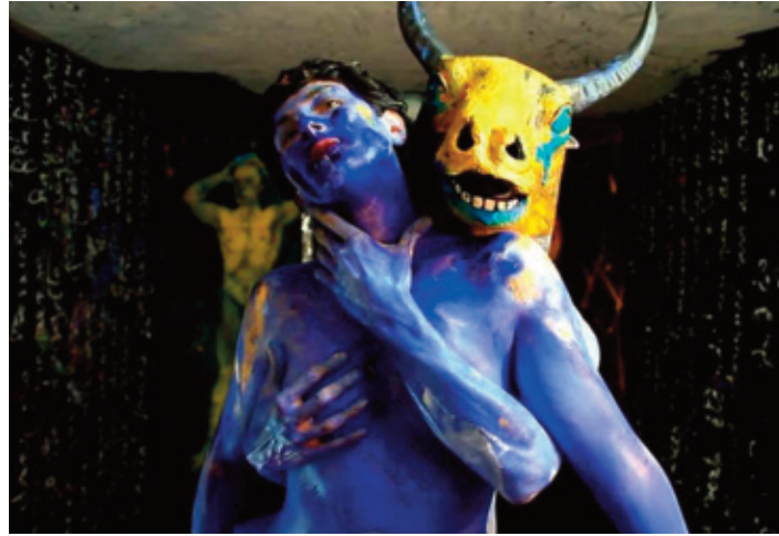
La puissance des mythes est sans cesse réactualisée.

Depuis lors, notre modèle greco-romain, esclavagiste, patriarcal et colonialiste, se déploie au cours