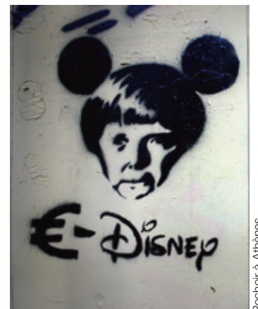
Pochoir à Athènes.

Tsatsiki Mezzé populaire grec désormais taxé à 24 %, comme tout le reste.