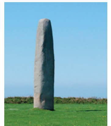
Phallus breton, dit menhir de Kergadiou, haut de 8,75 m.

Phallus La domination patriarcale existerait-elle sans l'érection du pénis ? Symbole de la force virile et de la fécondité, le phallus est le Maître du monde. De nos jours, certains hommes peuvent être tentés d'utiliser d'autres objets symboliques pour faire preuve de leur virilité, comme le tonfa. Du nom d'une arme traditionnelle japonaise, cette matraque moderne est un instrument à la mode chez les forces de police.