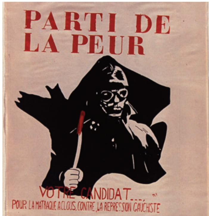
Affiche de mai 68.

Nous commenterions les petits arrangements électoralistes sans évoquer la violence des médias, à la solde des grands groupes financiers, nous assénant la crise à toutes les sauces, pour alimenter la peur économique. Ainsi, transis par l'angoisse du lendemain, nous devrions suivre une voie inéluctable, selon que l'on est catholique, musulman, capitaliste ou frontiste.